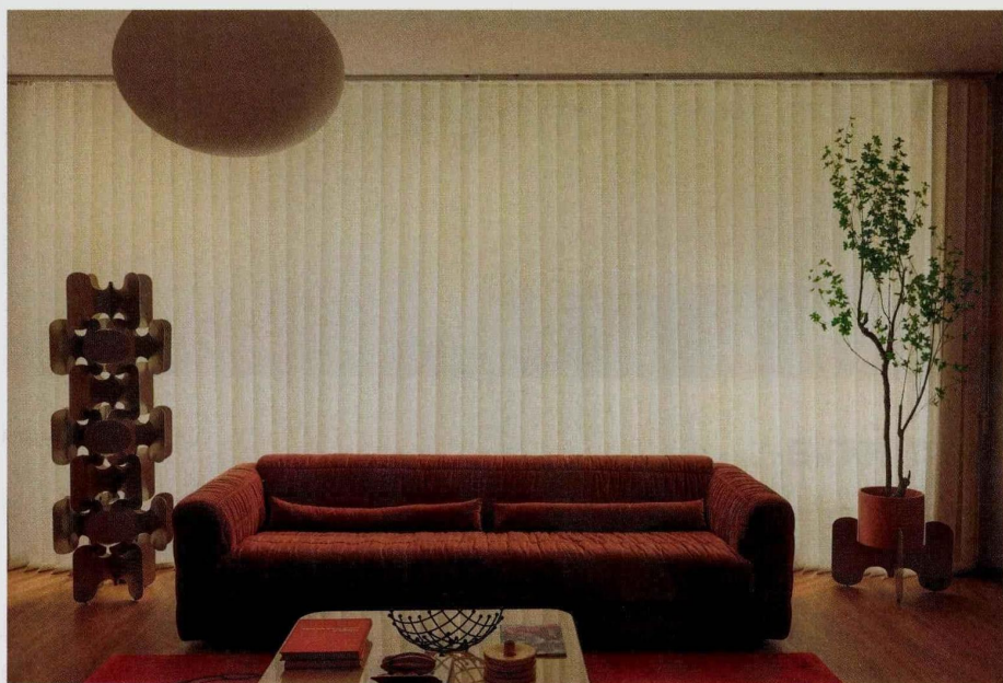
Ci-dessus, suspension et appliques signées Amca Oval, collection "Aurora".